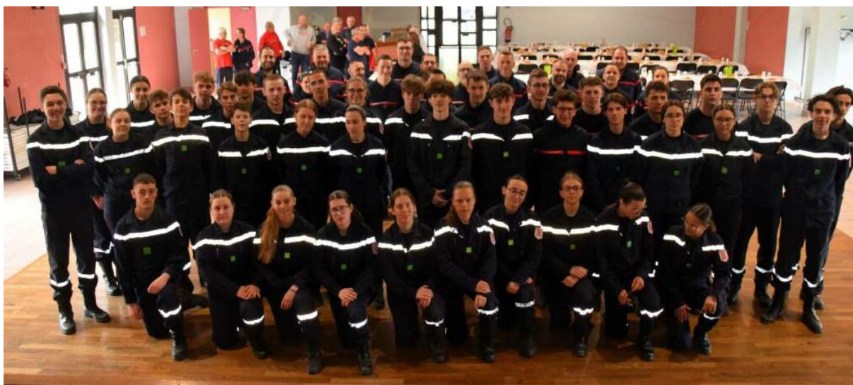
Les 47 jeunes sapeurs-pompiers du Tarn-et-Garonne et les formateurs.

Le samedi 6 avril, le centre de secours de Dunes a été transformé en centre d'examen pour une journée. Les 47 jeunes sapeurs-pompiers du Tarn-et-Garonne, qui ont passé le brevet de 4 ème année, ont ouvert leurs portes dès 8h30. Ce brevet comprend 4 épreuves pratiques qui impliquent la recherche des victimes et les ARI, ainsi que la mise en place du lot d'éclairage, la manœuvre de protection contre les chutes et la manœuvre incendie. Les formateurs sont issus de divers centres de secours tels que Beaumont de Lomagne, Lafrançaise, Saint-Antonin-Noble-Val, les Apprentis d'Auteuil et aussi Dunes. Après avoir obtenu la validation de l'épreuve sportive qui aura lieu le 4 mai prochain à Castelsarrasin. Les jeunes sapeurs-pompiers auront la possibilité d'intégrer un centre de secours qui se trouve à proximité de leur lieu de résidence. François-Xavier Hebrard, président de l'Union Départementale des sapeurs-pompiers du Tarn-et-Garonne (UDSP), a assisté aux épreuves. Les jeunes sapeurs-pompiers sont sous la responsabilité de l'UDSP et du SDIS. Le collège Sainte-Claire sous la fondation des Apprentis d'Auteuil, à une section jeunes sapeurs-pompiers (JSP) bénéficie d'une organisation et d'un équipement unique en Tarn-et-Garonne.