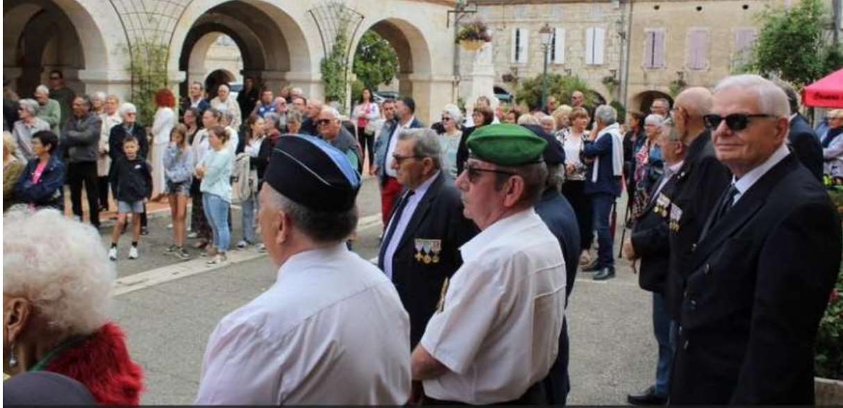
Une foule compacte et recueillie en souvenir des victimes de la division Das Reich