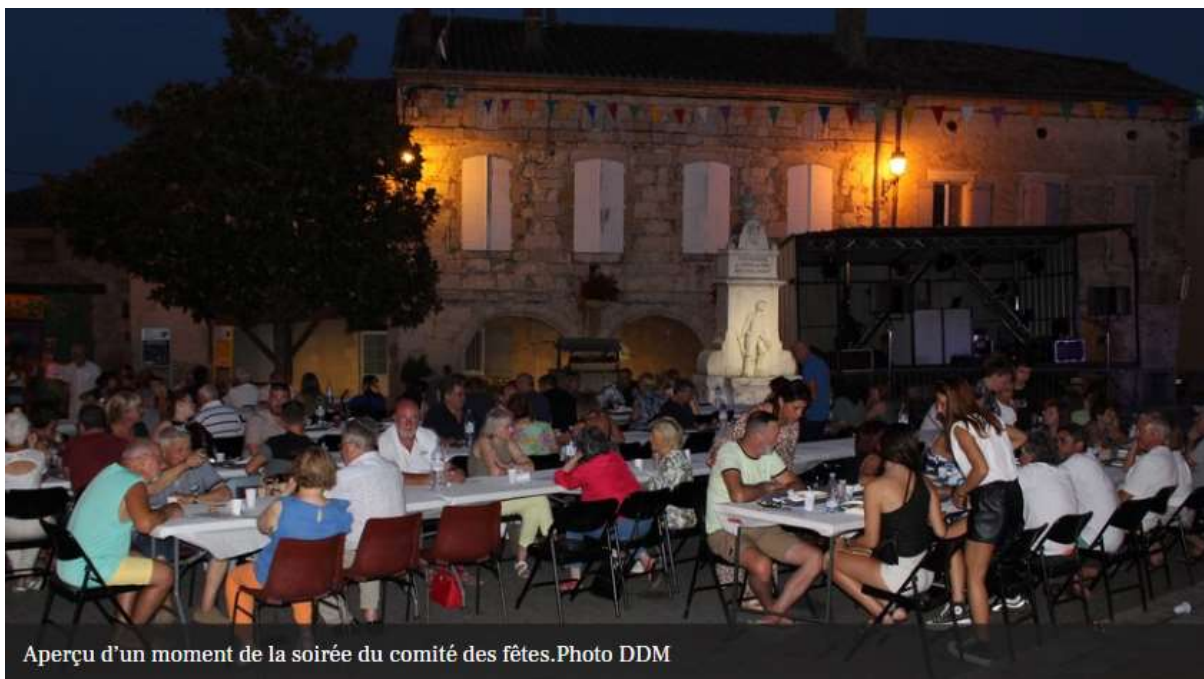
Aperçu d'un moment de la soirée du comité des fêtes.

Un air de jeunesse a soufflé sur la bastide pour la nouvelle équipe du comité des fêtes, cela a été un investissement sans faille afin que la traditionnelle fête du village soit une réussite durant cinq jours dans un climat de convivialité, d'éclats de rire et toujours dans une ambiance de partage.