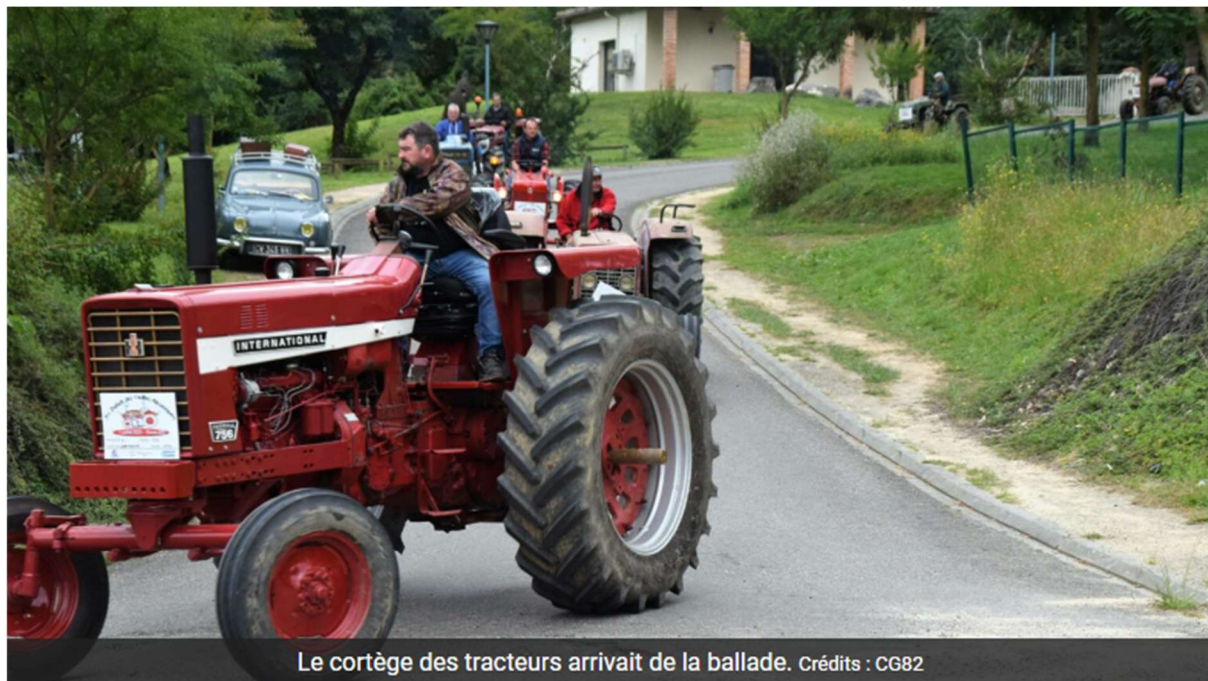
Le cortège des tracteurs arrivait de la ballade.

Les 86 véhicules anciens tous confondus : 50 tracteurs, 32 voitures anciennes et 4 motos se sont inscrits pour la balade organisée par l'association des Vieux Pistons.