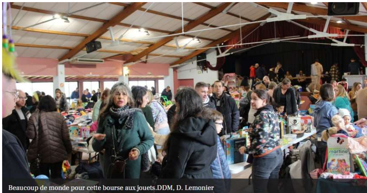
Beaucoup de monde pour cette bourse aux jouets.

L'Association de parents d'élèves a organisé une bourse aux jouets et aux vêtements d'enfants dimanche 19 novembre de 9 heures à 17 h 30, à la salle des fêtes Pôle Sud-Ouest : 37 participants, 80 tables bien achalandées. Cette édition a attiré la foule ravie de se replonger dans les allées remplies de jouets qui étaient à des prix imbattables, il y en avait pour tous les goûts. Cette manifestation contribue à favoriser la vente de seconde main : économique, écologique, qui préserve la planète, un geste qui fait comprendre aux enfants les enjeux environnementaux, une attitude écoresponsable des parents.