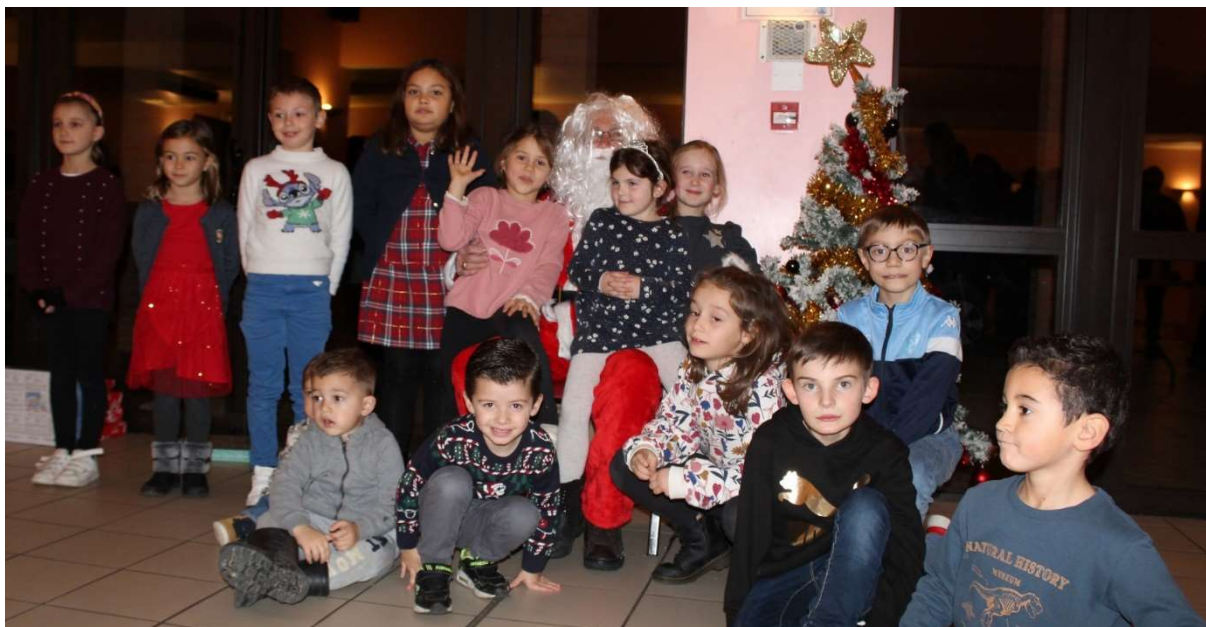
Les enfants, enchantés de voir le père Noël.

Bien que très occupé en ces temps de fêtes, ce dimanche 3 décembre, les enfants des joueurs du RCB 82 ont eu la visite surprise du Père Noël, celui-ci a pris le temps de venir en avance au club et a été accueilli par de très nombreux parents venus accompagner leurs enfants pour l'occasion, celui-ci a rejoint les petits bouts choux émerveillés avec sa hotte pleine de cadeaux.