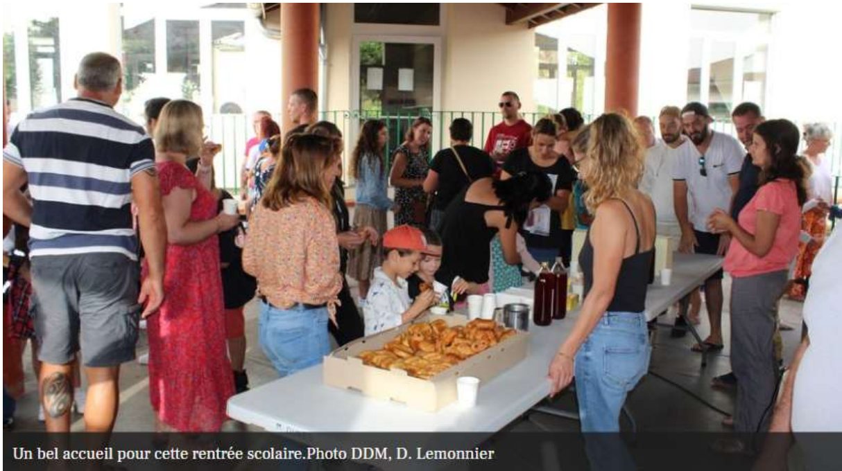
Un bel accueil pour cette rentrée scolaire.

Une rentrée ensoleillée pour les 7 professeures des écoles et les 122 élèves de l'école primaire Jean-Baylet de Dunes. Un établissement bilingue (français-occitan) qui suscite toujours de l'intérêt, les parents de cette école ont toujours le choix entre l'enseignement en français et l'enseignement bilingue. C'est un avantage d'apprendre les langues dès le plus jeune âge ; cet enseignement développe chez l'enfant des capacités linguistiques, une ouverture d'esprit et la connaissance d'une nouvelle culture. 70 élèves sont inscrits dans la section bilingue.